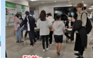
到着〜 お帰りなさい(*´▽`*)