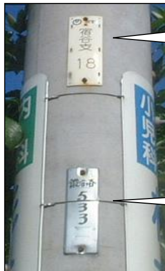
NTTの管理番号位置を示す

山や野原で行うオリエンテーリングのように、「町中の無数に在る電柱から、渡された地図に書いてある情報を元に、目標の電柱を早く歩いて探し、ポイントを競う競技」です。街の中に立っている電柱を見上げると、写真のような「謎の番号」が貼られていることに気が付きます。上の札は電話会社(NTT)が貼ったもので、その電柱が、基点(1)から何番目の位置にあるかを示すいわば「電柱の住所表示札」のようなものです。下の札は東京電力の管理番号札ですが、探した答えとして書いてきます。サーチウォークは、この両方の番号札を競技に使います