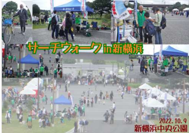
2022. 10. 9 新横浜中央公園

またランチタイムにはレク連合の方によるお楽しみ会もあって、歌のお兄さんによるギター合唱では大きな声で歌ったり、フォークダンスではみんなで手をつなぎ、懐かしい少年少女時代を思い出しながら踊られていました。