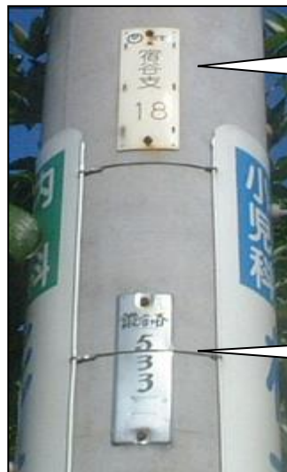
NTTの管理番号位置を示す

山や野原で行うオリエンテーリングのように、「町中の無数に在る電柱から、渡された地図に書いてある情報を元に、目標の電柱を早く歩いて探し、ポイントを競う競技」です。街の中に立っている電柱を見上げると、写真のような「謎の番号」が貼られていることに気がきます。上の札は電話会社(NTT)が貼ったもので、その電柱が、基点(1)から何番目の位置にあるかを示すいわば「電柱の住所表示札」のようなものです。下の札は東京電力の管理番号札ですが、探した答えとして書いてきます。サーチウォークは、この両方の番号札を競技に使います