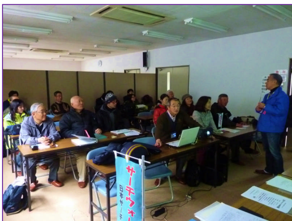
スタート前の競技の説明会場の様子

2月20日(日)、栄区田谷町「千秀公園センター」において競技会を「横濱タウン新聞」の取材のなかで行われました。20人を超える参加者で、梅花の香りを身に受けての競技会でした。坂道や長い階段の厳しい条件の中、新人2名の参加者がパーフェクトの得点を挙げたことは特筆に値する大会でした。多くの初参加者もあり、サーチウォークが益々ひろがり期待できる大会でした。